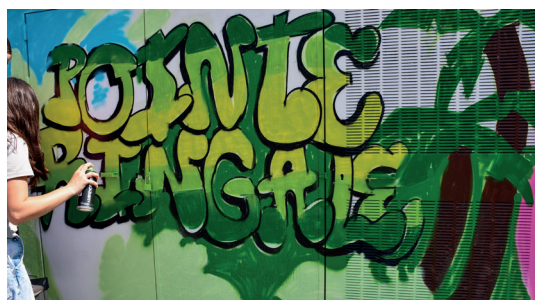
Projet graff - Pointe Ringale (Juin 2025)

Le Service Jeunesse et Sports s'associe à l'ASL Le Champ Dollent pour donner un nouveau visage au transformateur électrique situé sur la Coulée Verte.