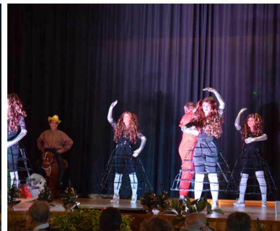
Les deux repas, le spectacle et la remise des colis