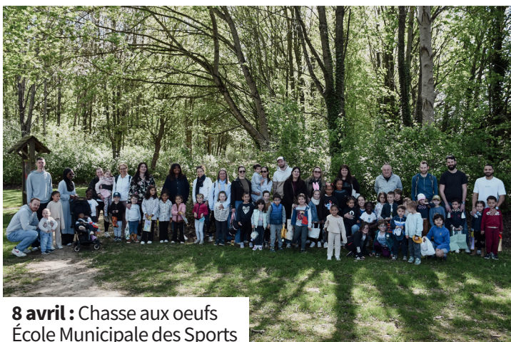
8 avril : Chasse aux oeufs École Municipale des Sports