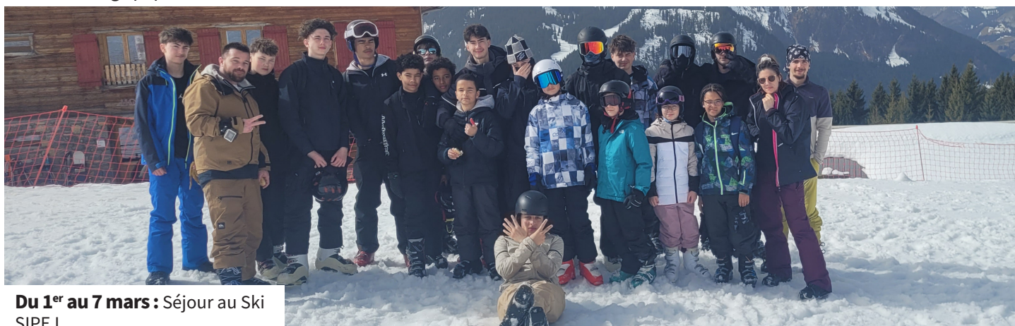
Du 1 er au 7 mars : Séjour au Ski SIPEJ