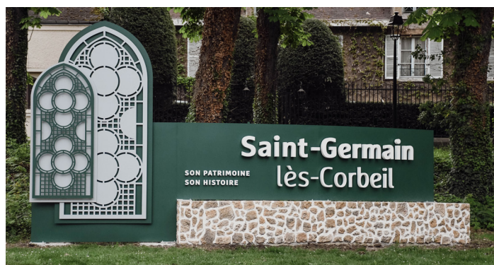
Son patrimoine et son histoire

Parce que c'est LA pierre de Saint-Germain-lès-Corbeil. On la retrouve sur les murs et sur les façades de notre patrimoine bâti. En l'intégrant aux entrées de ville, nous avons créé un lien visuel immédiat entre les nouveaux aménagements et l'âme de notre commune. Un clin d'œil aux anciens, un repère pour les nouveaux arrivants.