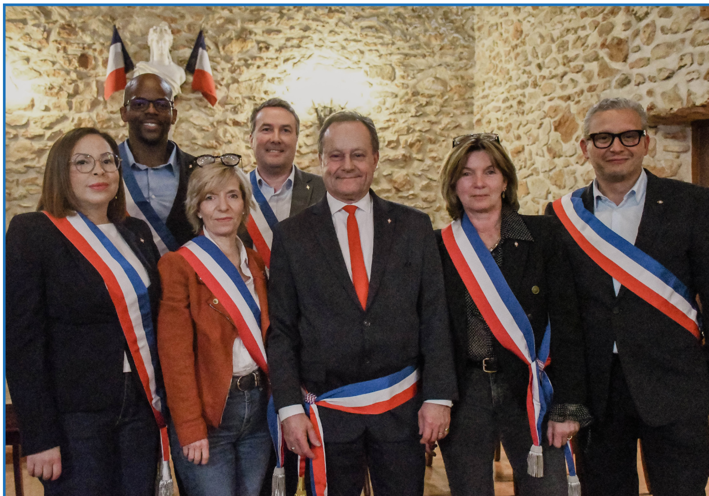
Le Maire et les Adjointes lors de la séance d'installation 20 mars 2026