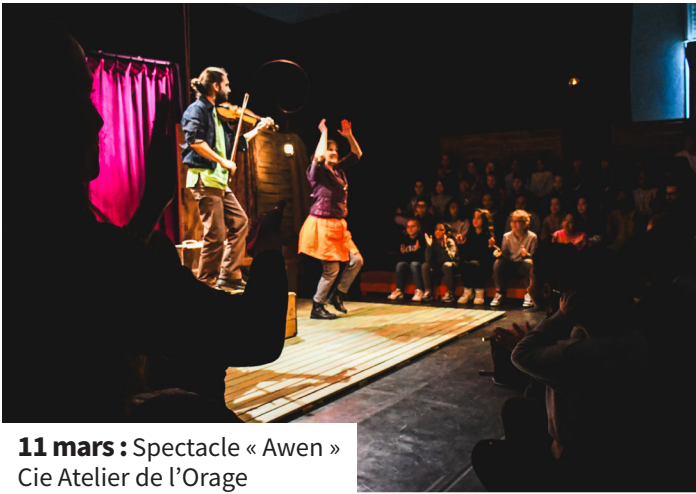
11 mars : Spectacle « Awen » Cie Atelier de l'Orage