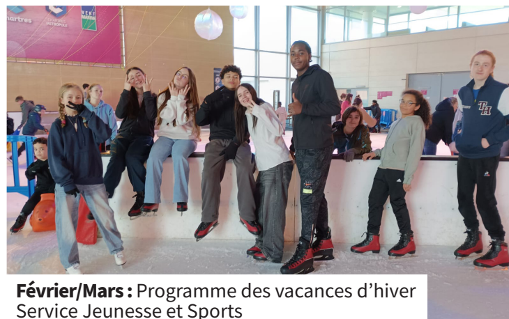
Février/Mars : Programme des vacances d'hiver Service Jeunesse et Sports