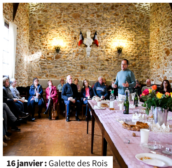
16 janvier : Galette des Rois