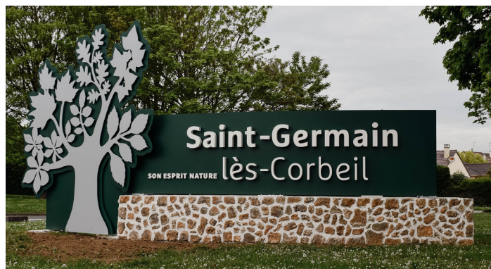
Son esprit nature

La première impression visuelle, c'est souvent la plus durable. Quand on arrive à Saint-Germain-lès-Corbeil, on entre dans une ville verte, paisible, riche d'un patrimoine qui remonte à l'époque gallo-romaine. Nos nouvelles entrées de ville sont là pour le dire, le montrer, l'affirmer dès le premier regard !