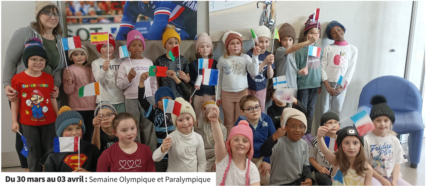
Du 30 mars au 03 avril : Semaine Olympique et Paralympique