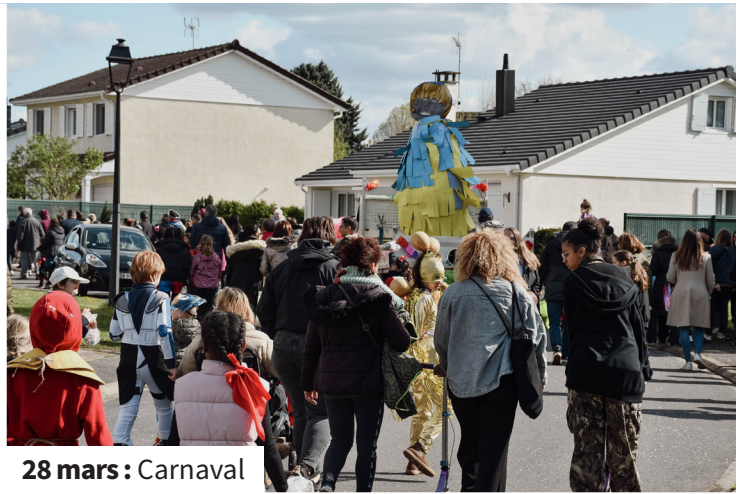
28 mars : Carnaval