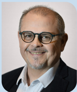
Alain Dal Zotto