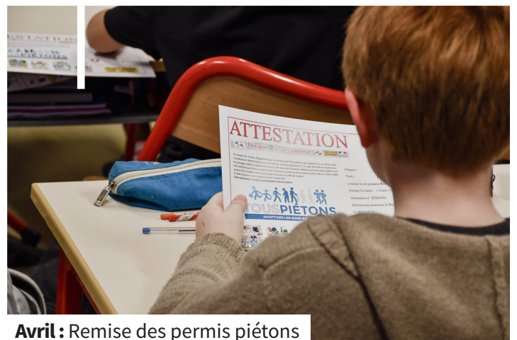
Avril : Remise des permis piétons