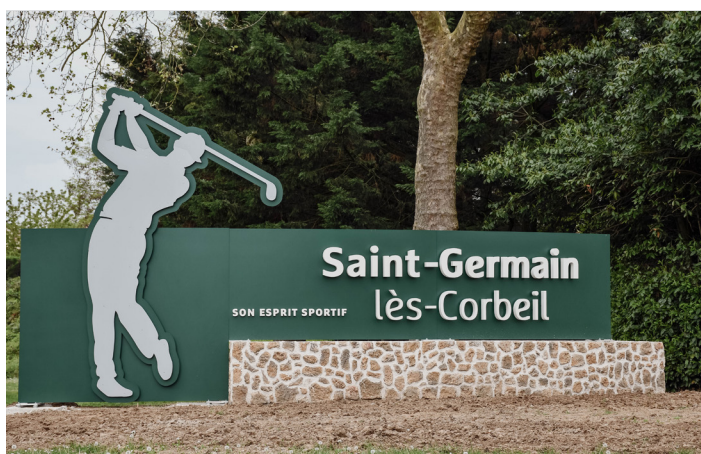
Son esprit sportif