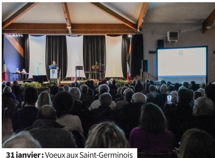
31 janvier : Voeux aux Saint-Germinoïses