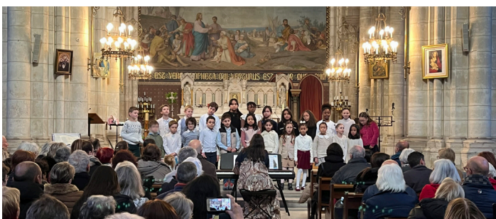
Concert « Chœur Ensemble(s) »

Ce projet fédère ainsi toute la population autour d'une démarche de transmission et d'ouverture culturelle, en lien avec les sites emblématiques du territoire de Grand Paris Sud.