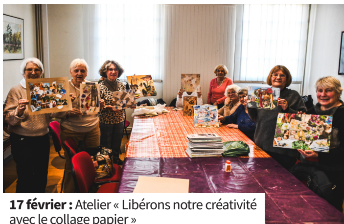
17 février : Atelier « Libérons notre créativité avec le collage papier »