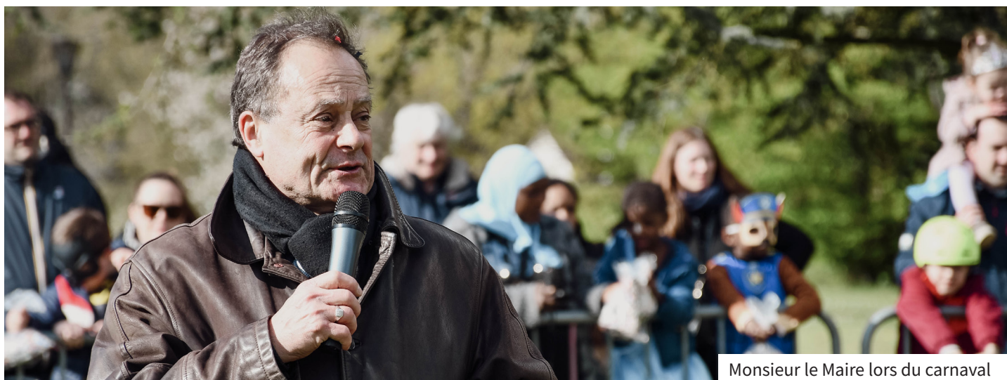
Monsieur le Maire lors du carnaval

Mesdames, Messieurs, Chères Saint-Germinoises, Chers Saint-Germinois,