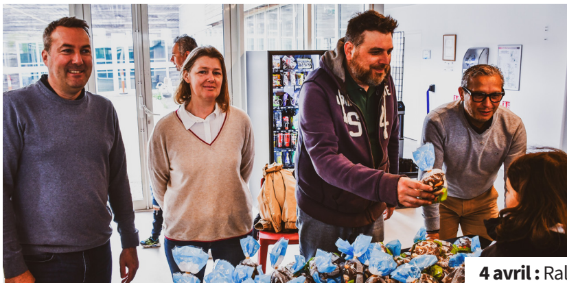
4 avril : Rallye des oeufs